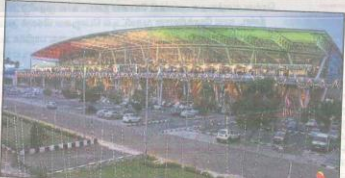
செய்ப்பாக்கல் விமான நிலையம்

துறைமுகம் இந்தியாவின் மிகப்பெரிய துறைமுகங்களில், மும்பைக்கு அடுத்தபடியாக, சென்னை இடத்தை வகிப்பது, சென்னை துறைமுகம். சென் மாநிலங்களின் துறைமுகங்களில் எந்த பெருமை, சென்னைக்கு கிடைக்கா. இந்த துறைமுகம் தான் காரணம். சென்னைக்கு பொருளாதார வளர்ச்சிக்கு, இந்த துறைமுகம், ஒரு முக்கிய காரணி. கச்சா எண்ணெயை இறக்குமதி செய்வதற்கும், டிரைபென்ட், கிரானைட், சூடுகன், காசி மற்றும் இரும்புத் தாது போன்றவற்றை ஏற்றுமதி செய்வதற்கும், இந்த துறைமுகம் முன்னிலை வகிக்கிறது.