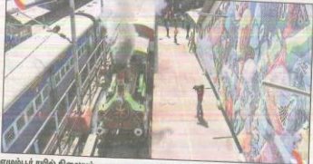
எழும்பூர் ரயில் நிலையம்

ரயில் போக்குவரத்து சென்னையின் சென்ட்ரல், எழும்பூர் மற்றும் தாமிரவரு ஆகிய இடங்களில், முக்கிய ரயில் நிலையங்கள் உள்ளன. சென்னைக்குள்ளும்,