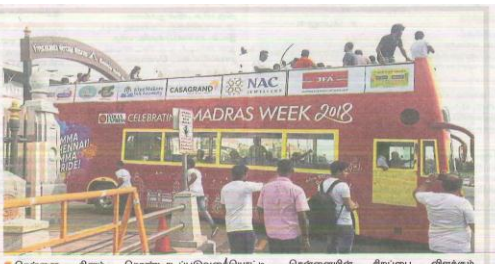
சென்னை திரைமேட்டப்பட்டபோட்டி, சென்னையில் சிறுமார் வண்டிகளும், மக்களின் பரணவகைகள், சிறப்பு பேருந்து உருவாக்கப்பட்டு உள்ளது. அந்த, தமிழ் வளர்ச்சி மற்றும் தென்மேற்கு துறை அமைச்சர் பரணவாதாரம், நேற்று துவங்கின. இடம் சென்னை, விவேகனாந்திர இடம்கலம்.