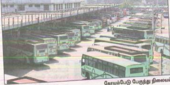
சோயம்பேடு பேருந்து நிலையம்

சென்னையில், பெரும்பாலான ஆட்டோ டிரைவர்கள், நாள்தோறும் காலைகளில் ஈட்டுப் பணத்தை, வெளியூர்களுக்குள்ளும் ஓடு வாகனங்களில் மீட்டுகின்றனர். ஆகையால், பணவியலில், ஆட்டோ டிரைவர்கள் திறமை நிக்கை குறைந்தும், ஆட்டோ டிரைவர்களை, வேலைகள், வியாபாரிகளுக்கு, நடுத்தர வர்க்கத்தினர், சுகமிகள் வாழ்வாதாரம் சென்னை என்பதால், அதன் வளர்ச்சியில் என்னுக்கு பெருமை நான்