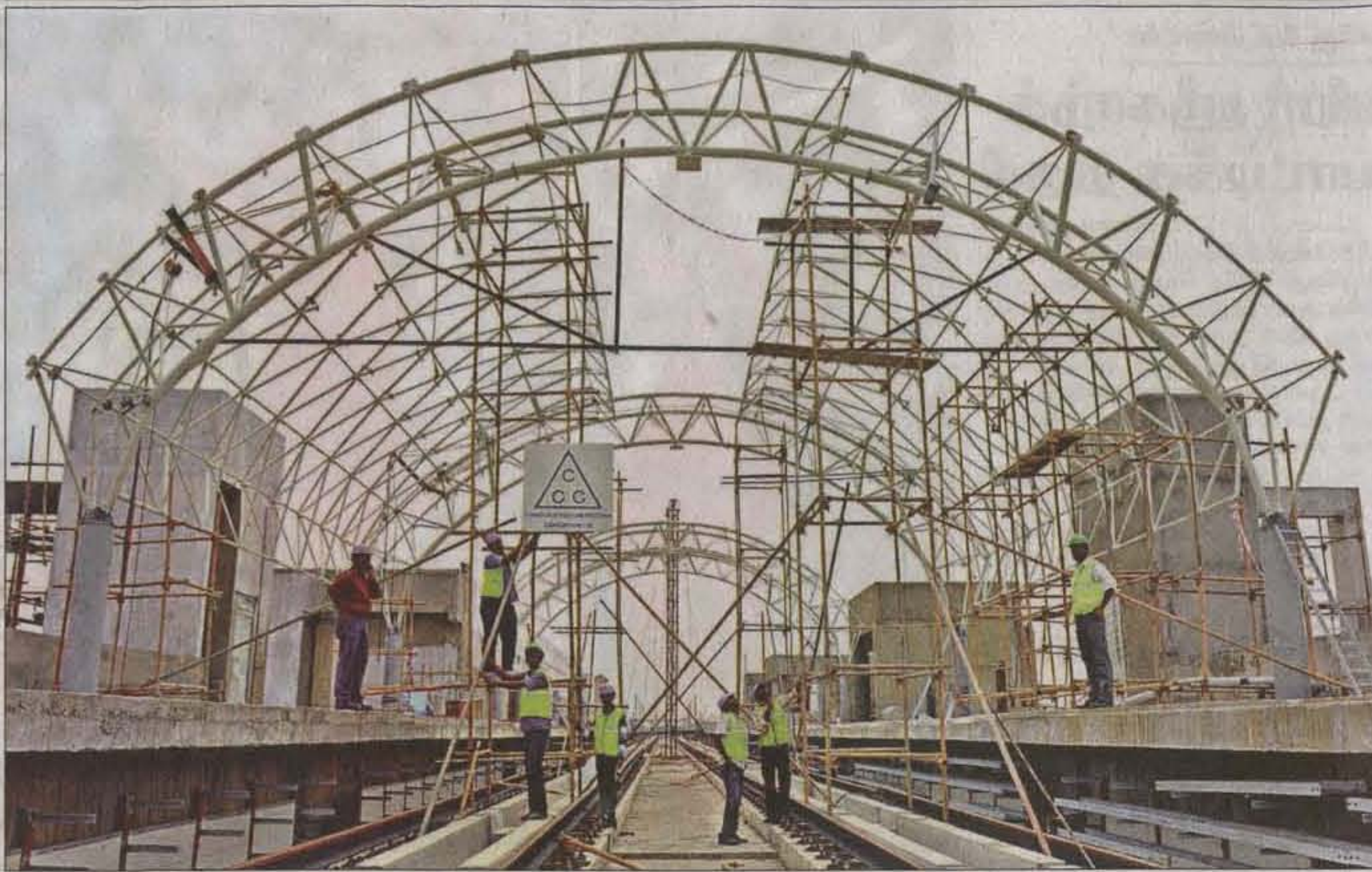
கோயம்பேடு ரெயில் நிலையத்திற்கு மேற்கூரை அமைக்கப்படுவதை படத்தில் காணலாம்.